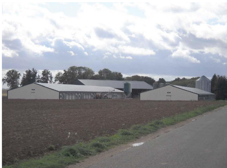
Figure 2 : Vue générale du site.

Les densités prévues à l'intérieur des bâtiments varient de huit dindes en croissance à 16,59 dindes en démarrage par m 2 et jusqu'à 24,21 poulets par m 2 , ce qui correspond à la densité maximale dérogatoire de 42 kg/m 2 au titre de la réglementation relative au bien-être des poulets de chair (voir discussion au § 2.2).