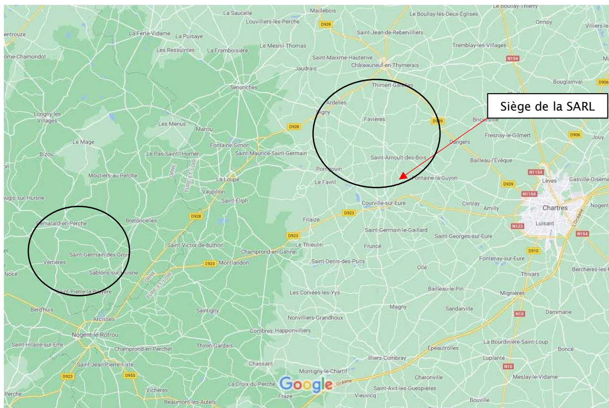
Figure 1 : Plan de situation. Les secteurs actuels d'épandage du fumier sont approximativement à l'intérieur des ovoïdes.

La SARL du Brosseron exploite un élevage intensif de volailles de chair de 73 500 « animaux équivalents » correspondant à 21 000 dindes en présence simultanée, au lieu-dit « Le Brosseron » à Saint-Arnoult-des-Bois, en Beauce dans l'Eure-et-Loir.